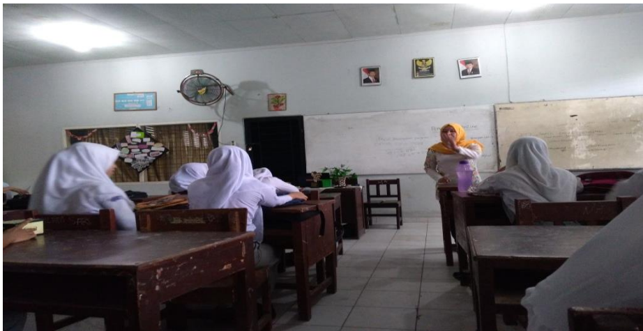
Gambar 1. Foto kegiatan Abdimas