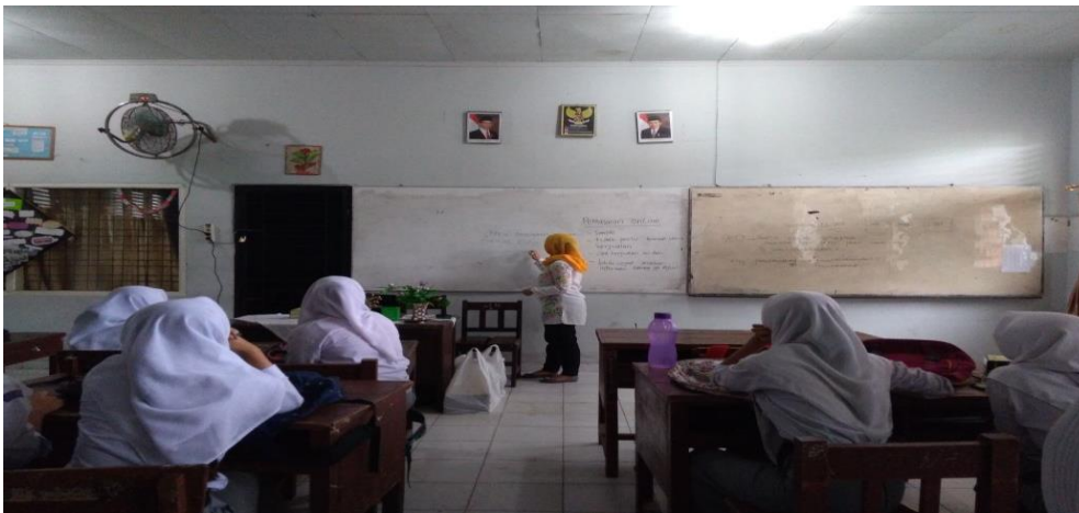
Gambar 2. Foto kegiatan Abdimas